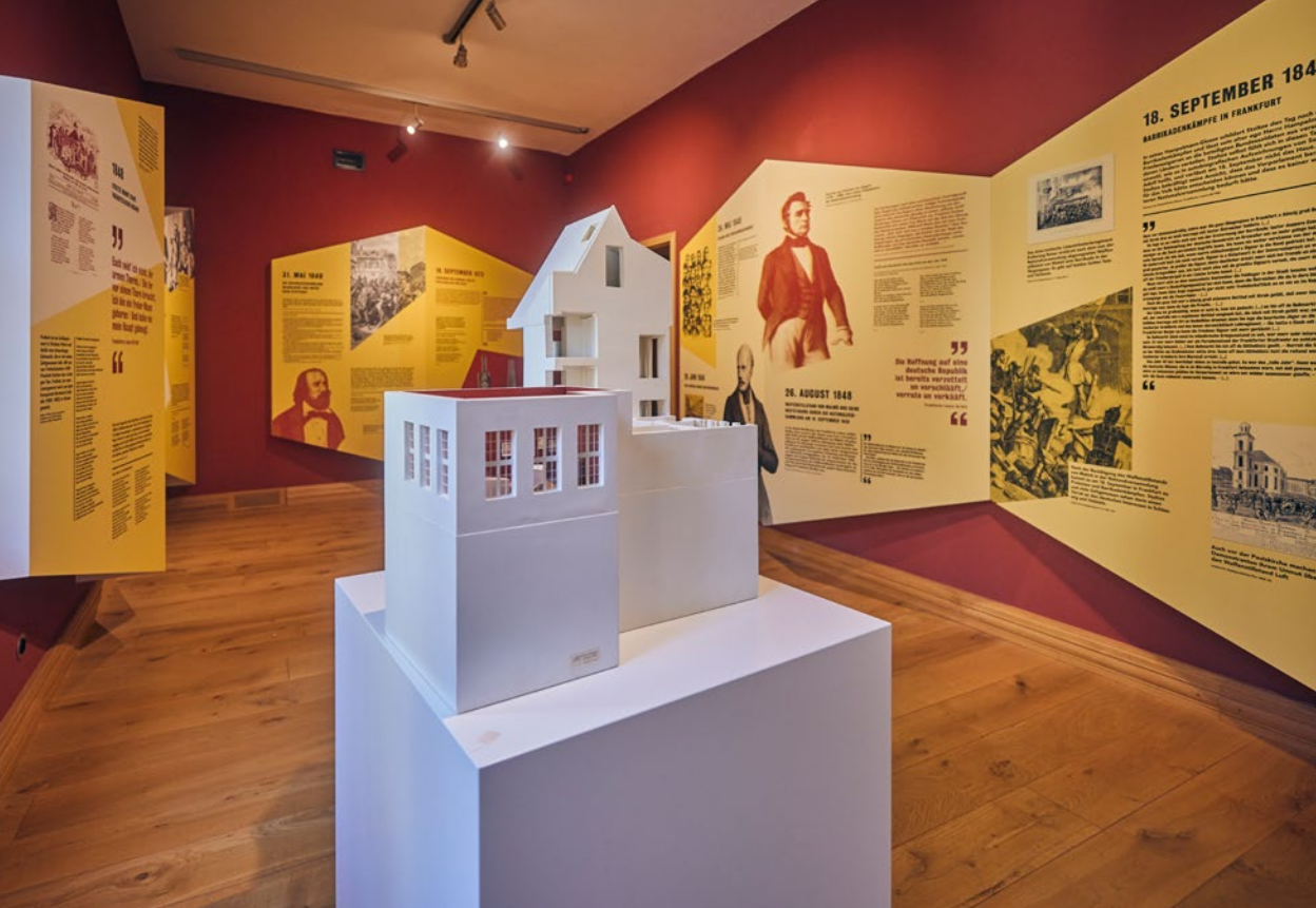
Stoltze-Museum der Frankfurter Sparkasse