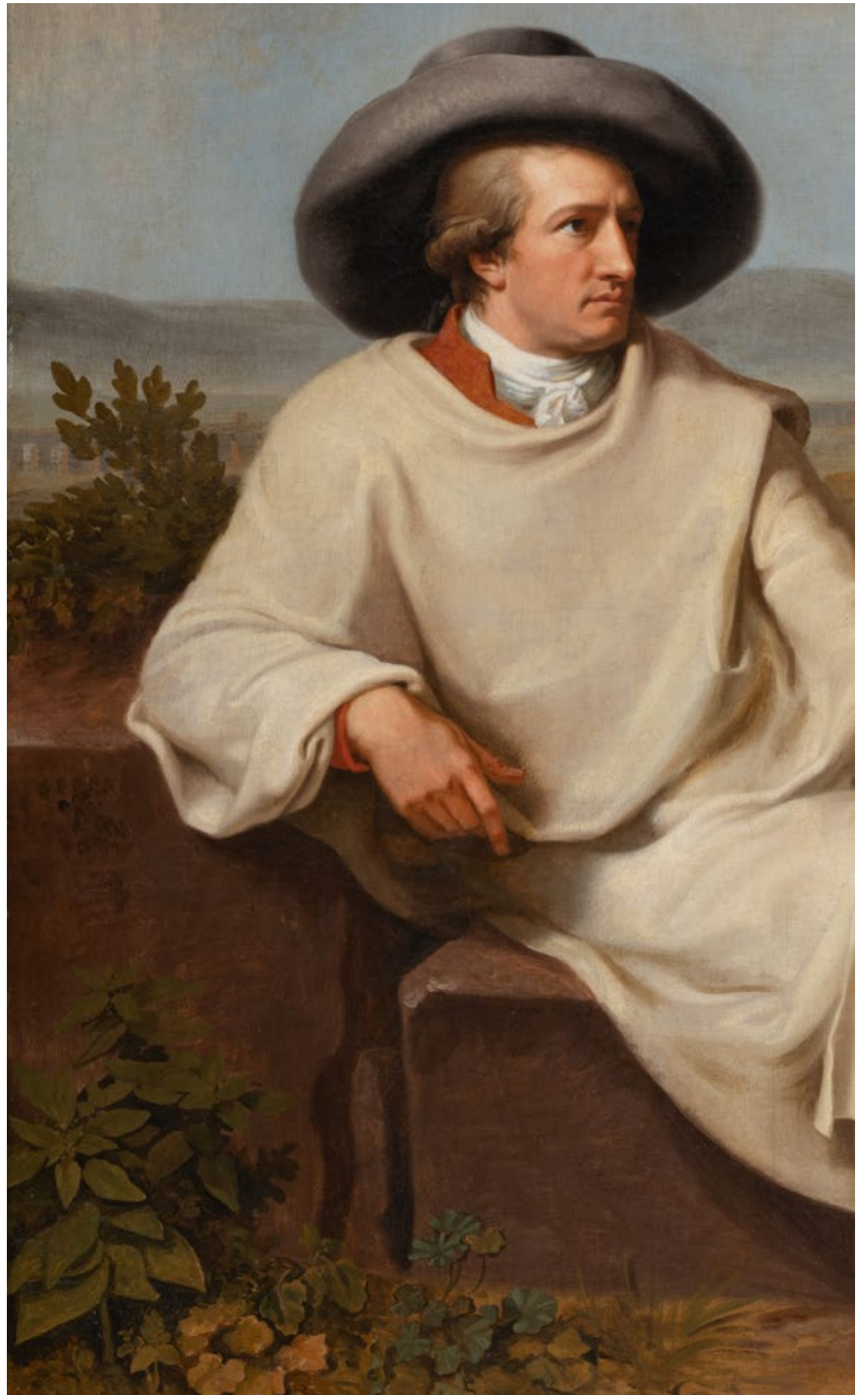
JOHANN HEINRICH WILHELM TISCHBEIN, Goethe in der römischen Campagna, 1787 166 x 210,3 cm, Öl auf Leinwand (Ausschnitt)